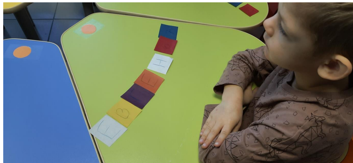
Математические пазлы «Мое имя»