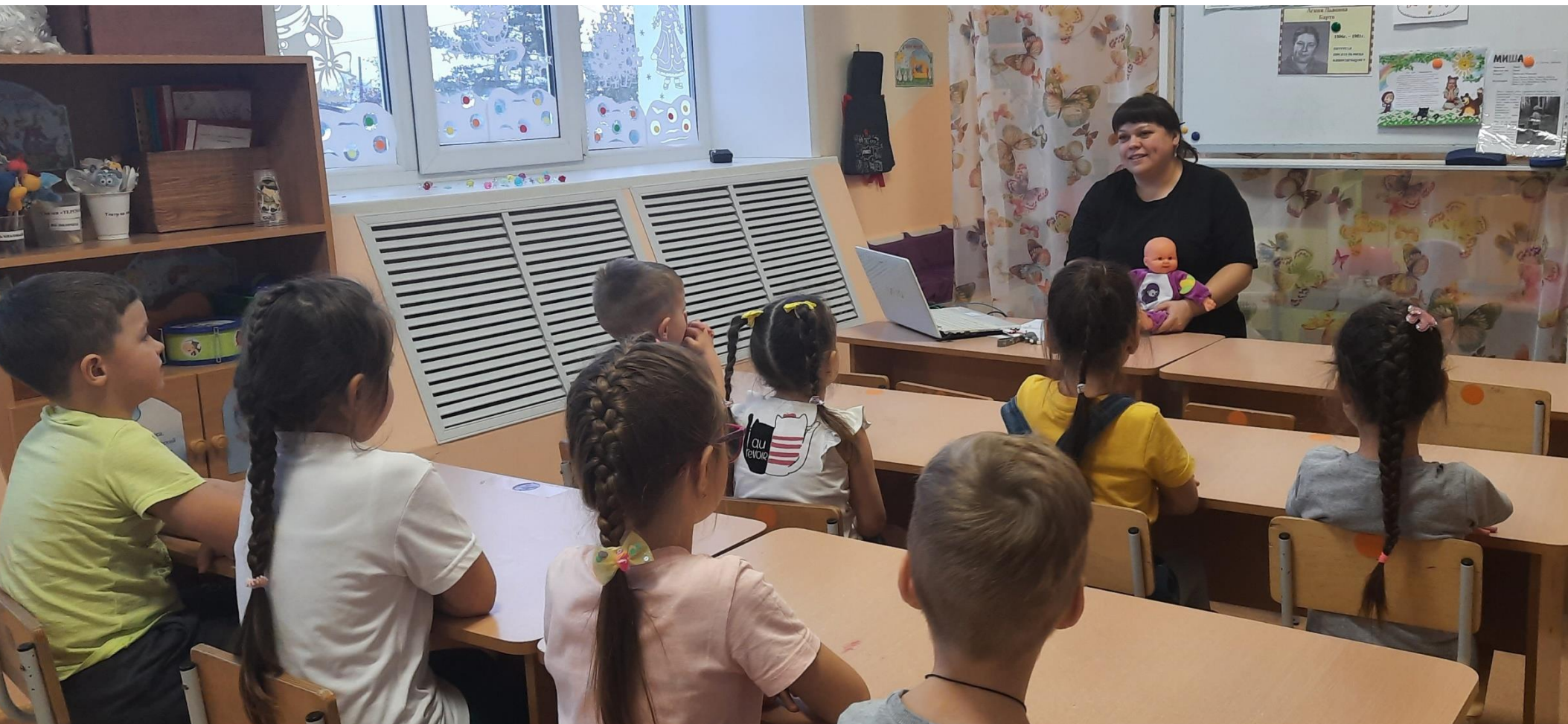
Чтение и обсуждение А. Барто «Имя и фамилия»