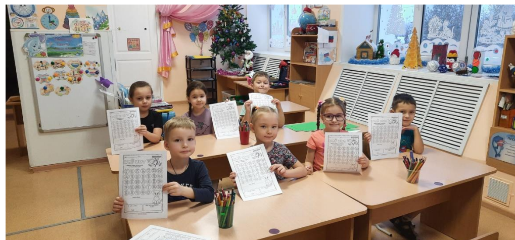
Разгадывание ребусов об именах девочек и мальчиков, загадок об именах.